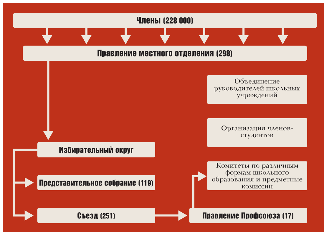
Организация профсоюза учителей.